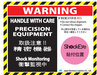
精密機器用 警告ラベル