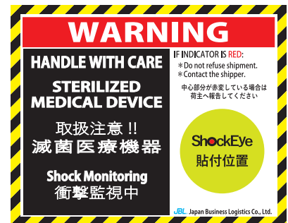
滅菌医療機器用 警告ラベル